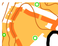
Traces sur l'herbe (champs ou forêt)

Il est obligatoire de toujours rester avec son vélo et sur les zones cartographiées cyclables. En dehors des chemins et routes, ceci comporte :